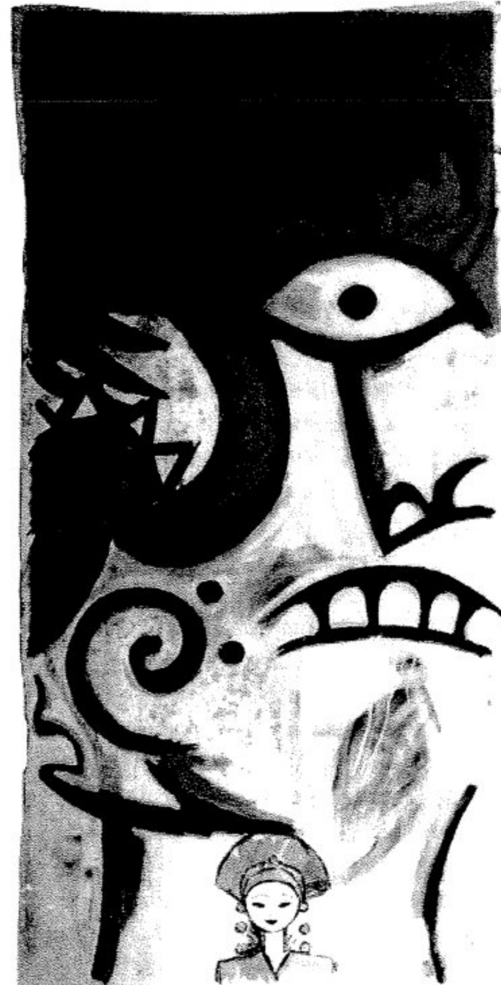
ingnegeriku Dim 45 x 285 cm SoHo/Gallery/9275

turmoilisrockingmycountry and it is a new scene we are all playing now